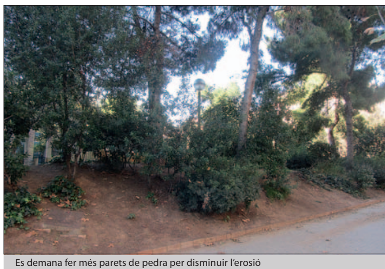
Es demana fer més parets de pedra per disminuir l'erosió

Com que nosaltres ja havíem fet la reunió, ja hem passat al Districte el resum de les peticions que van fer els veïns i veïnes que hi van assistir, sobretot gent gran. Us fem 5 cèntims del que es va sol·licitar: - Respecte a la masia: que sigui un equipament públic tipus ludoteca o/i esplai infantil, però que inclogui un petit bar i uns serveis utilitzables pels usuaris del parc. - Per no perdre més terra per l'erosió, posar parets de pedra seca en la part