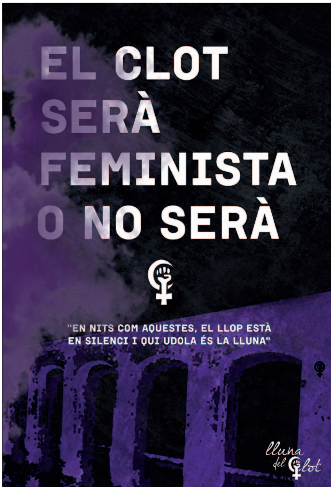
Cartell barraques de Clot-Camp de l'Arpa