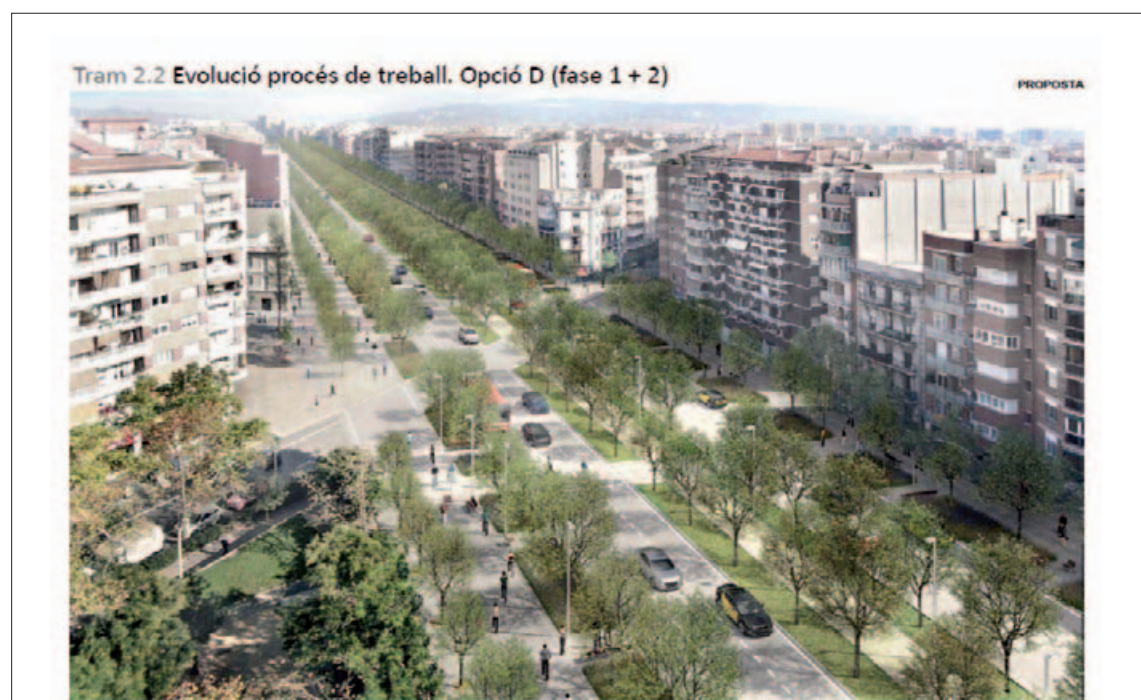
Imatge virtual, i molt "verda i optimista", de com seria el sector de la plaça Dr. Serrat, amb la proposta base sobre la que treballarem

Si voleu col·laborar en aquest tema, passeu pel local o envieu un @ avv-clotcampdelarpa@gmail.com .