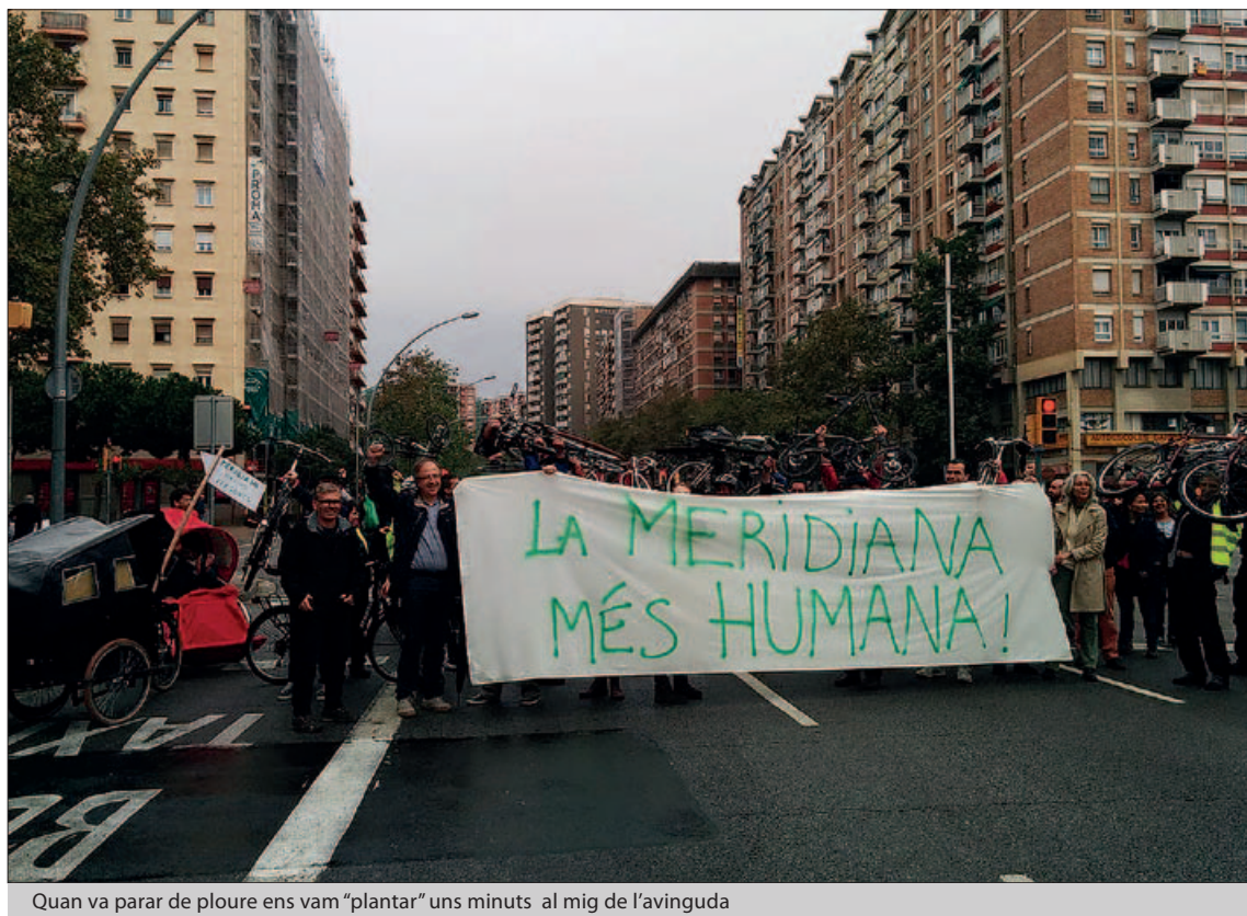
Quan va parar de ploure ens vam "plantar" uns minuts al mig de l'avinguda

El que sí que es va poder fer van ser les xerrades sobre contaminació de l'aire, mobilitat sostenible, i sobre la bicicleta a la ciutat. Van ser molt interessants, ja que els ponents eren experts en els temes i vàrem poder conèixer moltes dades i experiències d'altres ciutats europees. A més, en un moment que no plovia, ens vam animar a tallar simbòlicament la Meridia-